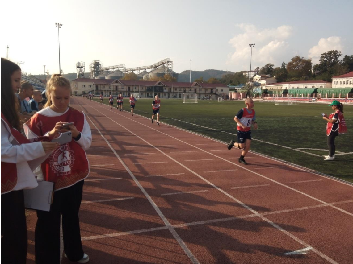
Бег 2000 метров- выдержать усилием воли. Финишируют кадеты 7 класса