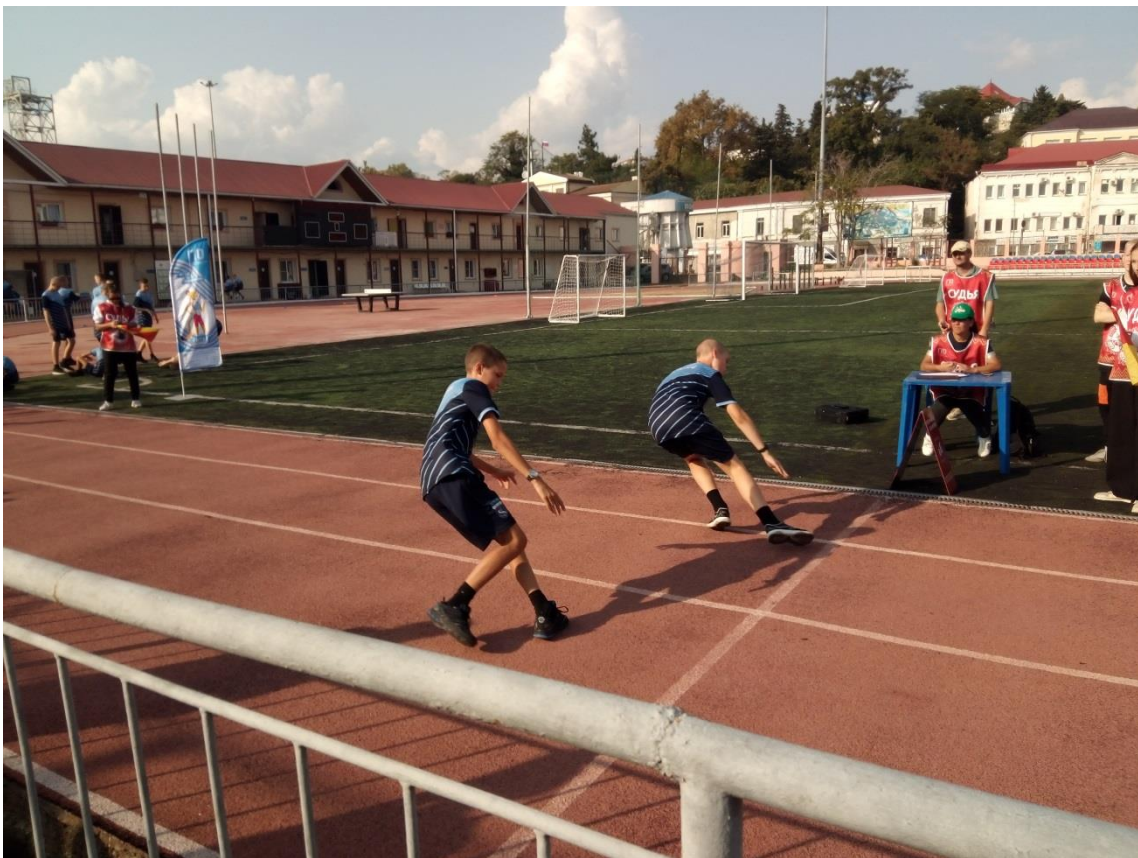
В челночном беге – главное разворот