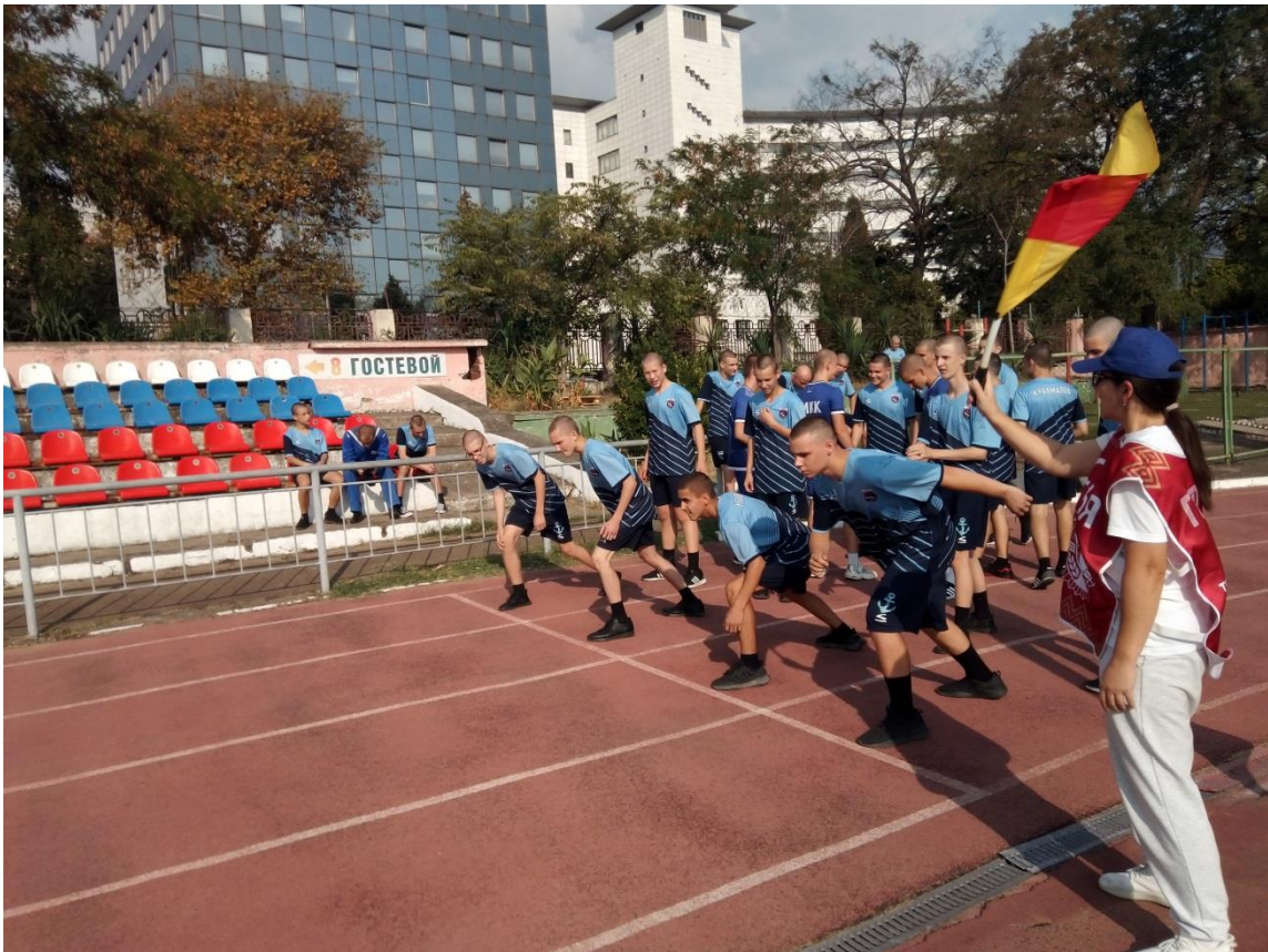
Нормативы 4 степени (бег 60 метров) сдают кадеты 9 класса